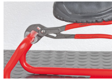
Los dientes desplazados con respecto al sentido de giro provocan un efecto de auto-retención y evitan el deslizamiento sobre la pieza.