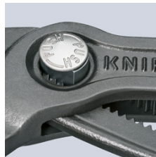
Ajuste rápido mediante botón: rápido y cómodo