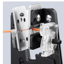
Dénudage suivant la forme du câble grâce aux profils coupants de précision

Sous réserve de toute modification technique et erreur.