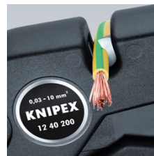
Coupe-fils pour fils multifilaires jusqu'à 10,0 mm 2