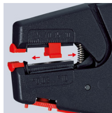
12 40 200: Butée longitudinale réglable