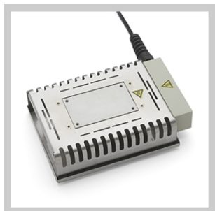
Piastre di preriscaldamento