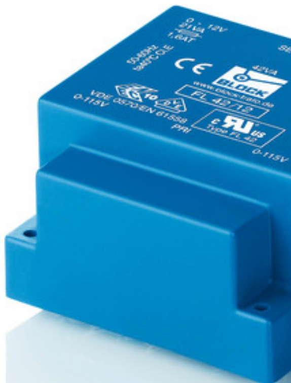
Photo de la ref. FL 42/12