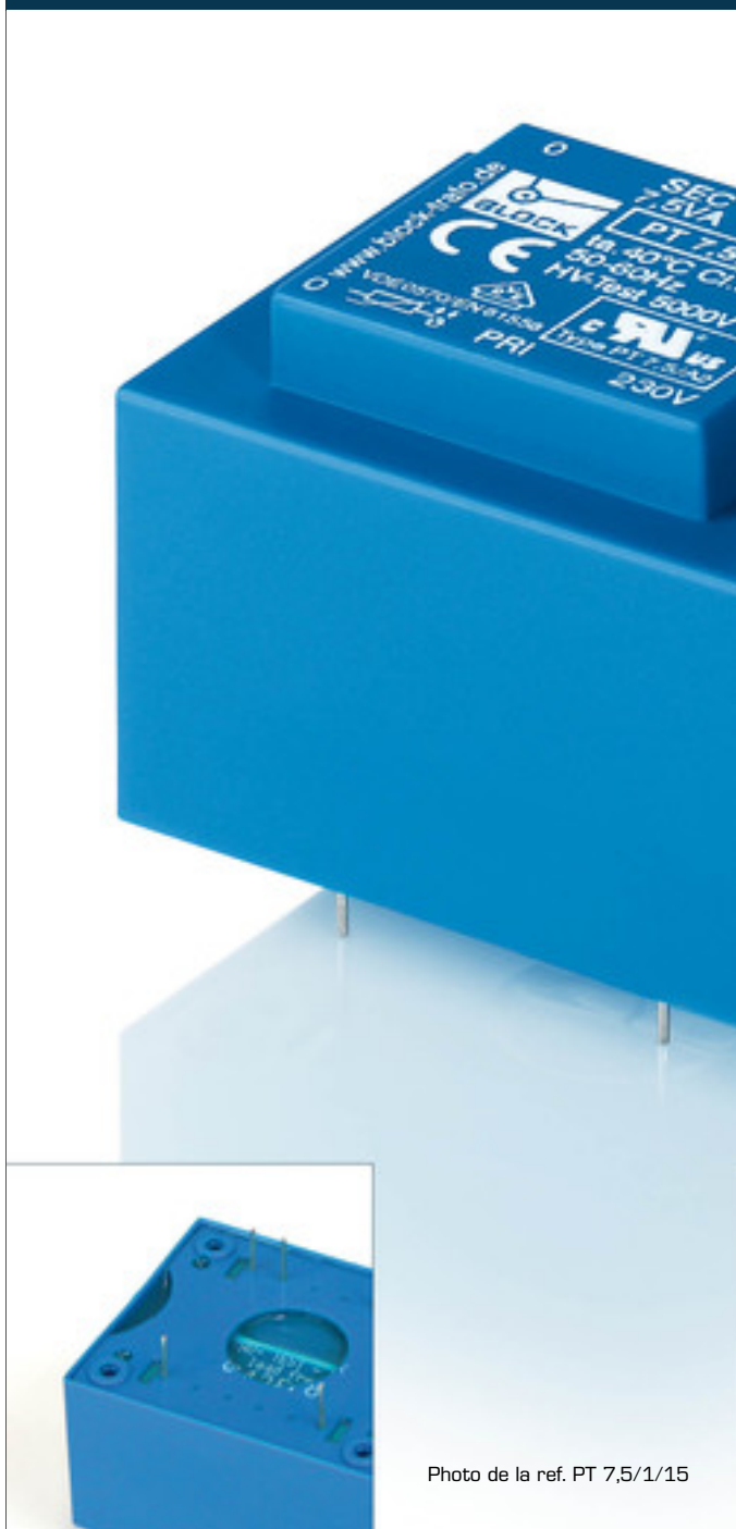
Photo de la ref. PT 7,5/1/15