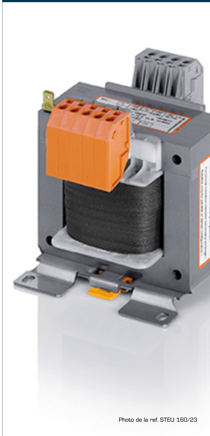
Photo de la ref. STEU 1600/23