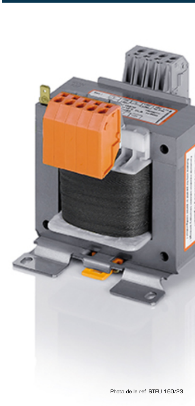
Photo de la ref. STEU 160/23