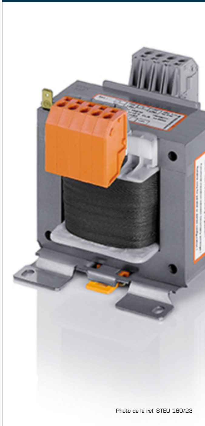
Photo de la ref. STEU 160/23