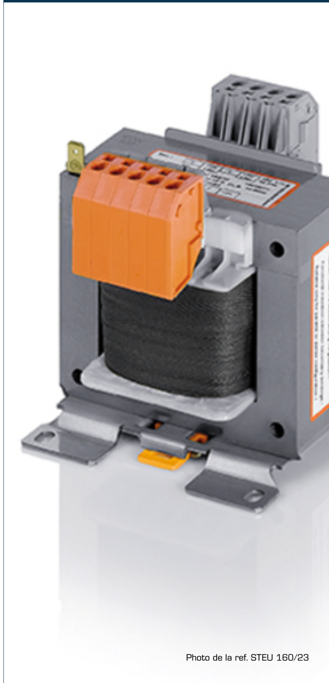
Photo de la ref. STEU 160/23