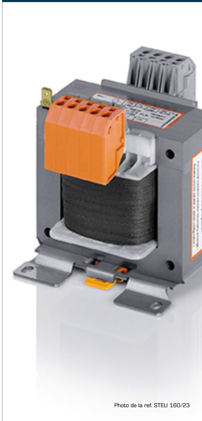
Photo de la ref. STEU 160/23