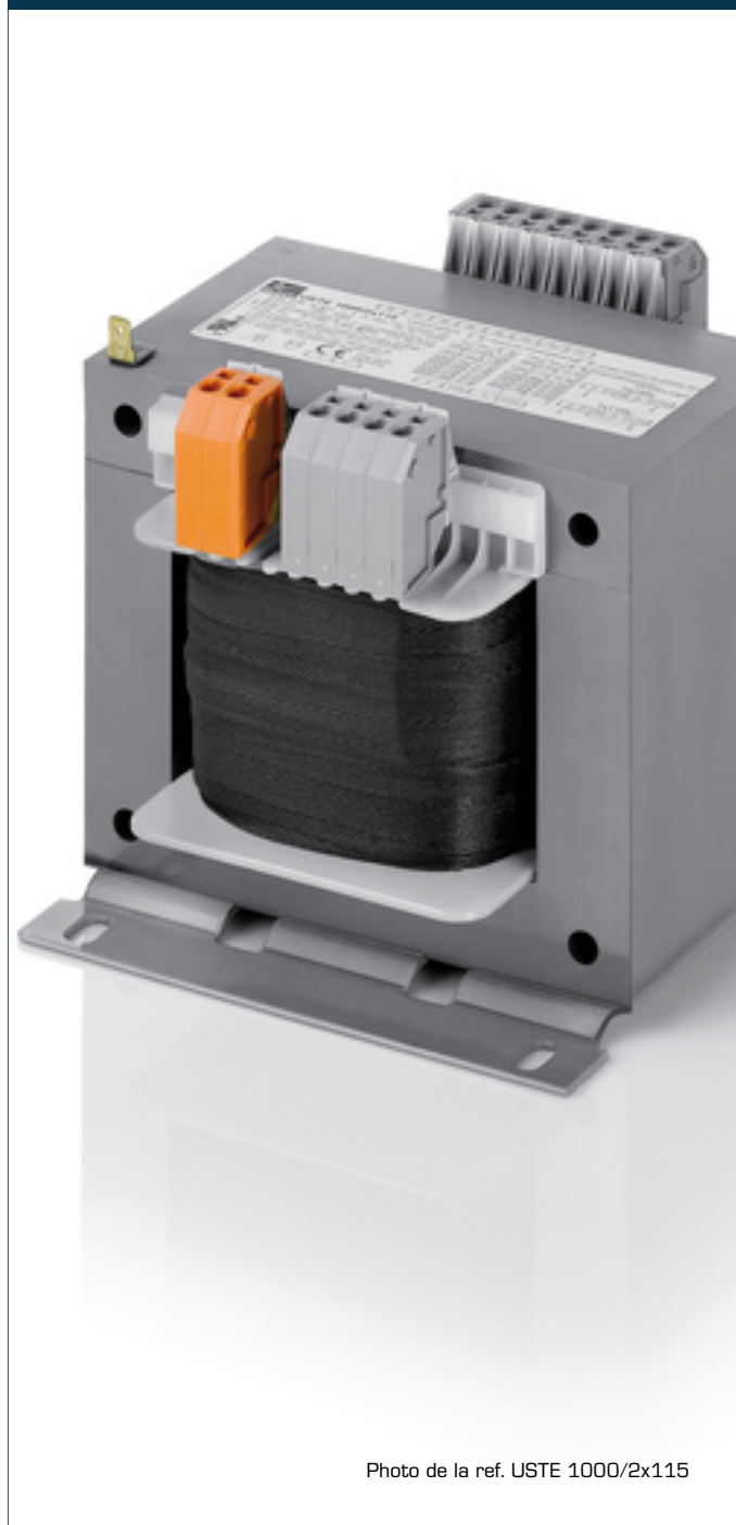
Photo de la ref. USTE 1000/2x115