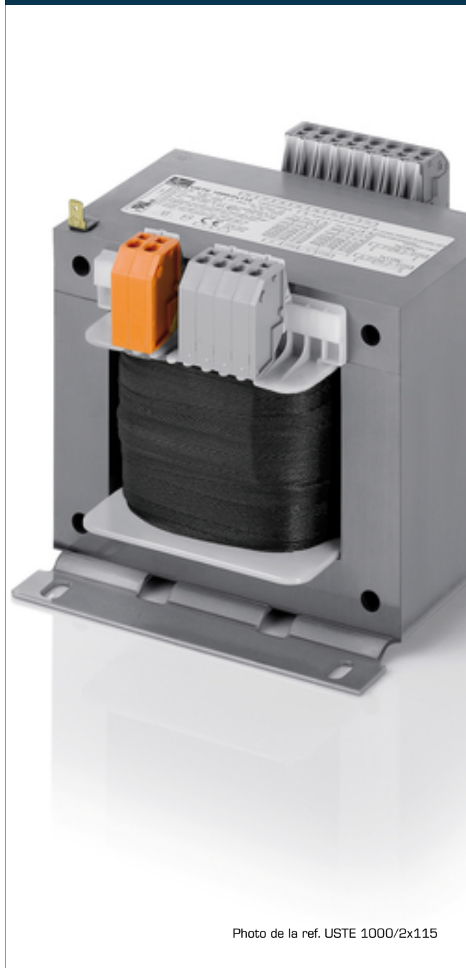
Photo de la ref. USTE 1000/2x115