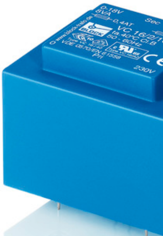
Photo de la ref. VC 16/2/18