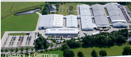
Factory 1, Germany