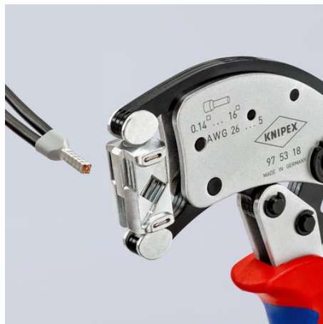
Wyjątkowo elastyczne: tulejki kablowe można umieścić w obrotowej głowicy do zagniatania prawie z każdej pozycji